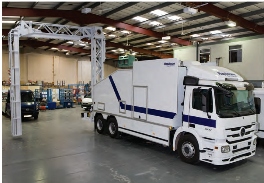
Система Rapiscan Eagle M60 на шасси Mercedes готова к проведению досмотра в любом месте.

Возможность сканирования крупных объектов: Eagle M60 в состоянии сканировать объекты до 5 м высотой, для чего может быть оснащена самым крупным из всех систем Eagle досмотровым туннелем.