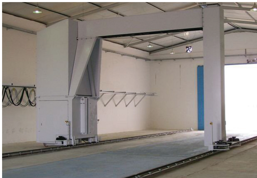
Rapiscan Eagle G60 в стационарной конфигурации; устанавливается в помещении, обеспечивает автоматизированное сканирование.

Установленная на рельсах и имеющая мощный источник рентгеновского излучения напряжением 6 МВ, Eagle G60 – рентабельная автоматизированная система досмотра.